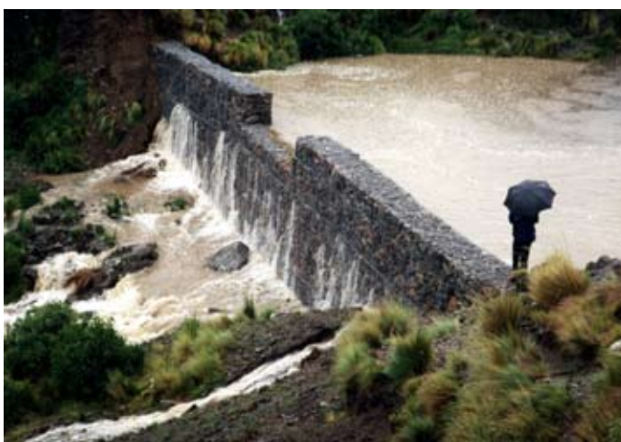
Figura 2 – Barragem construída com gabiões.