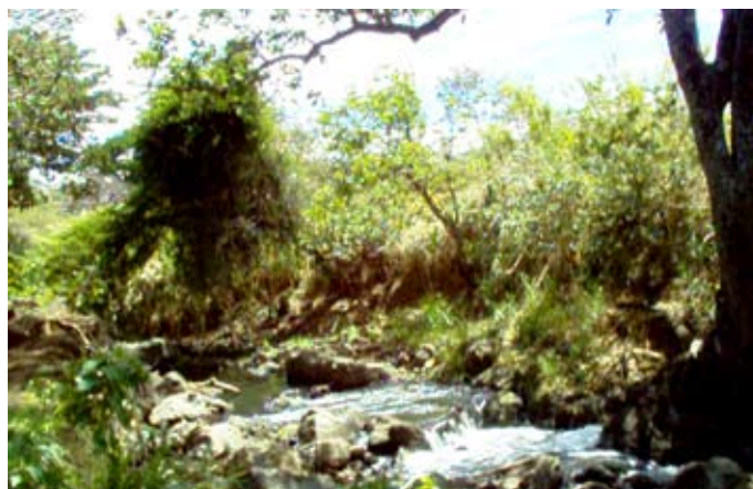
Antes da obra

Esta solução foi especialmente vantajosa devido à economia gerada e principalmente à rapidez construtiva que possibilitou sua execução em época de chuvas.