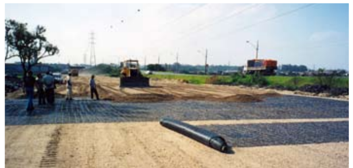
Figura 03 – Aterro sobre solo mole reforçado com geogrelhas MacGrid®.