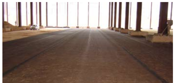
Figura 02 – Reforço de base de pavimento com geogrelhas MacGrid®.