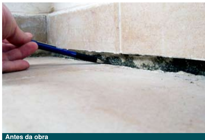
Antes da obra

Neste muro foi instalado um sistema de drenagem com MacDrain® 2L a fim de captar o volume excessivo de água e encaminhá-la para uma caixa de inspeção e saída.