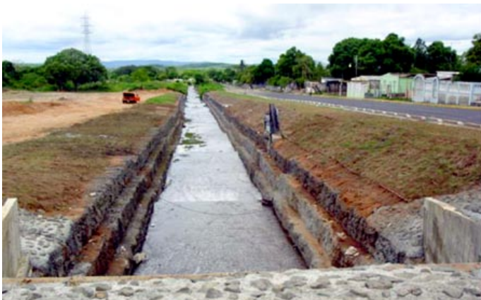
Depois da Construção