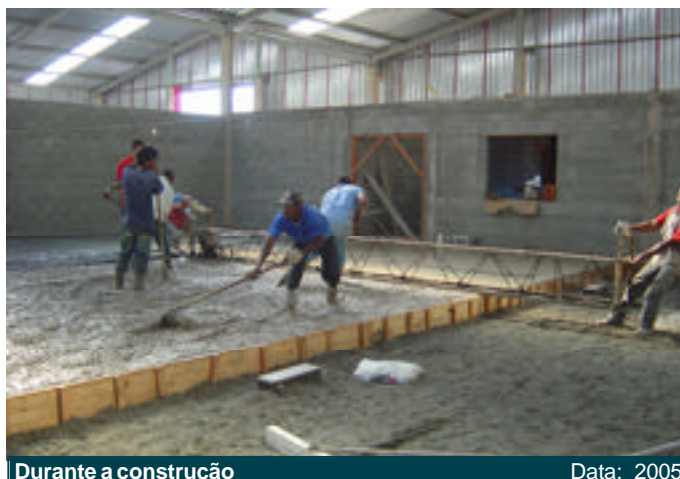
Durante a construção

Construção: 26/07/2005 Término: 28/07/2005