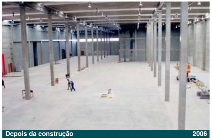
Depois da construção