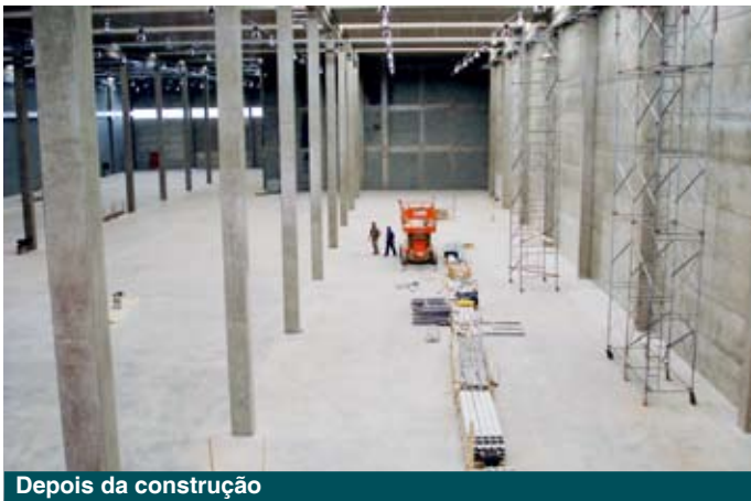
Depois da construção