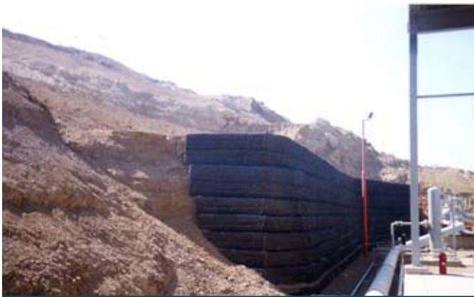
Depois da construção