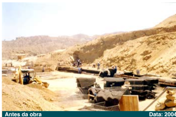
Antes da obra