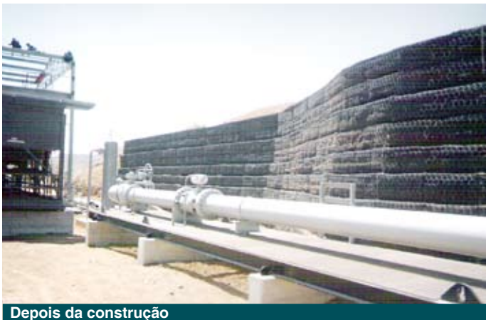
Depois da construção