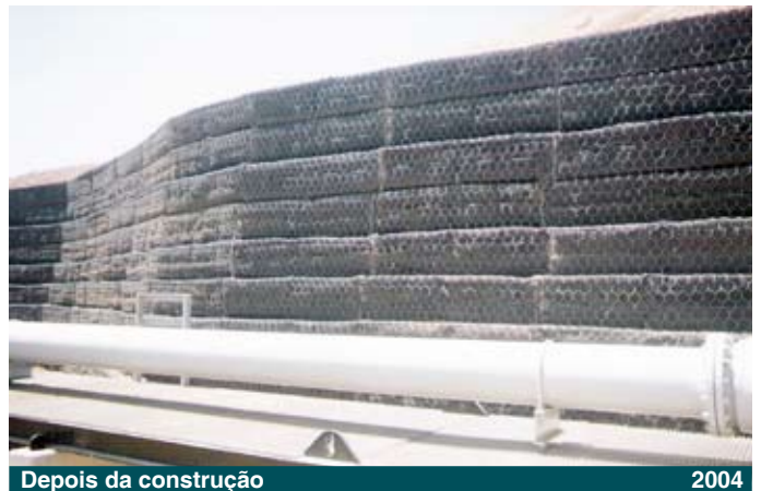
Depois da construção