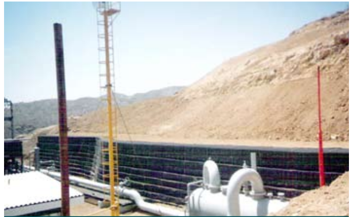
Depois da construção