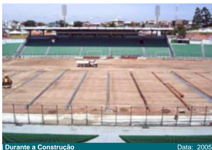
Durante a Construção