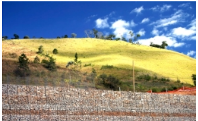
Depois da Construção