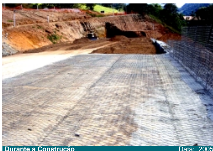
Durante a Construção