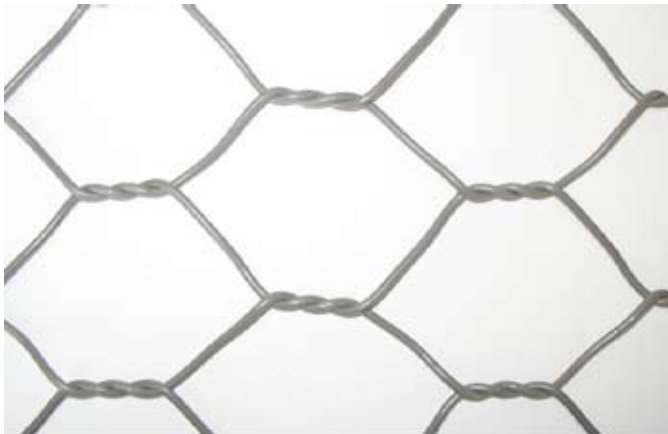
Figura 1 – Malla hexagonal en doble torsión.

La asociación de la simplicidad constructiva y funcional, la doble torsión y a otras tecnologías, como el revestimiento del alambre con la aleación Galfan® y el recubrimiento de PVC, aumentan de manera considerable la capacidad y la vida útil de las soluciones en malla hexagonal, posibilitando la construcción de obras más duraderas y funcionales.