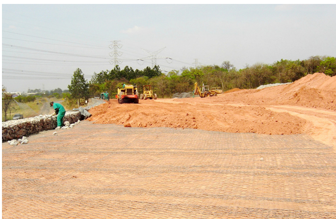
Foto 01 - Obra en construcción