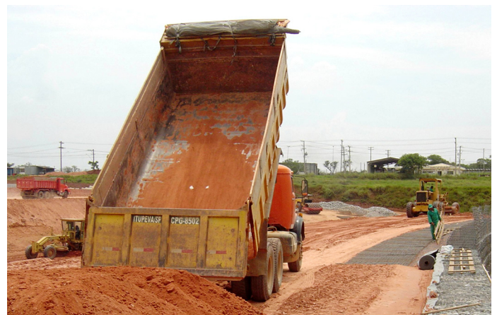
Foto 02 - Obra en construcción