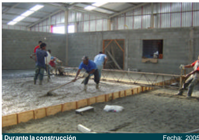
Durante la construcción

Construcción: 26/07/2005 Finalización: 28/07/2005