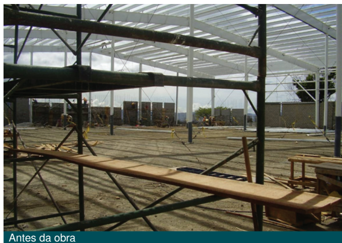
Antes da obra

O piso foi executado com sucesso e os resultados encontrados atenderam ao desempenho esperado.