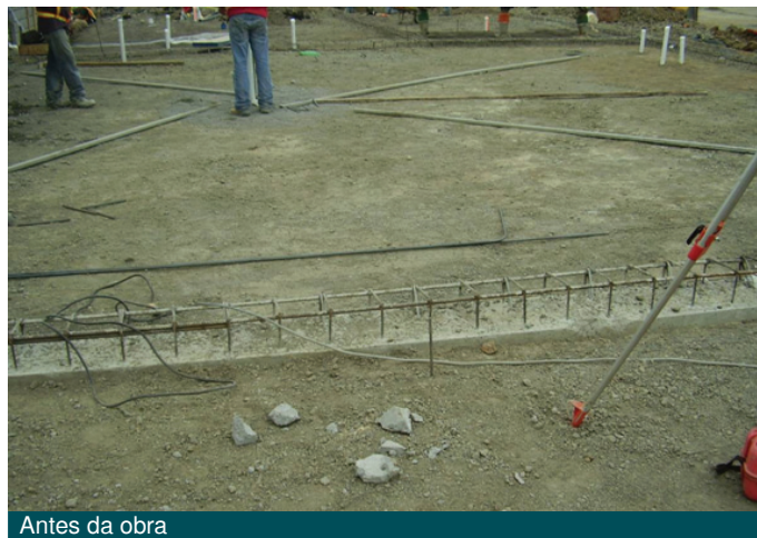
Antes da obra

O problema em questão ocorreu na construção de um piso industrial para a empresa Pricemart em Alajuela, que deveria, além de atender questões relacionadas à variações de temperatura e retração, também seria prioritária a adoção de soluções com o melhor desempenho possível.