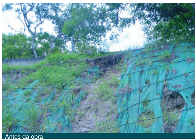
Antes da obra