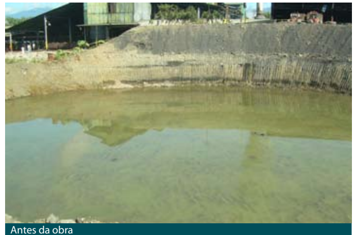
Antes da obra

Solos de baixa capacidade de suporte, também conhecidos por solos moles, somados à presença de um alto nível de lençol freático, complicaram a construção de um tanque de 30m de diâmetro nas instalações da planta industrial da Palma Tica situada na região sul do país.