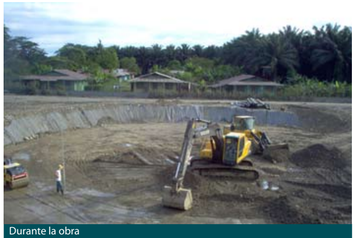
Durante la obra