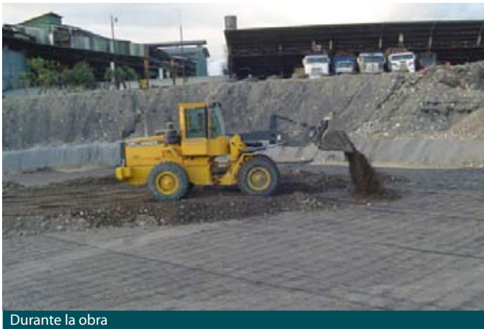
Durante la obra