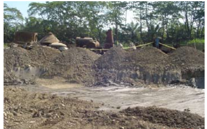
Durante la obra

La solución adoptada consistió en la sustitución del suelo de baja calidad por un suelo reforzado por capas de geogrillas MacGrid® de alta resistencia y separado de los demás volúmenes de suelo, por geotextiles no tejidos MacTex®. La obra superó las expectativas técnicas y económicas.