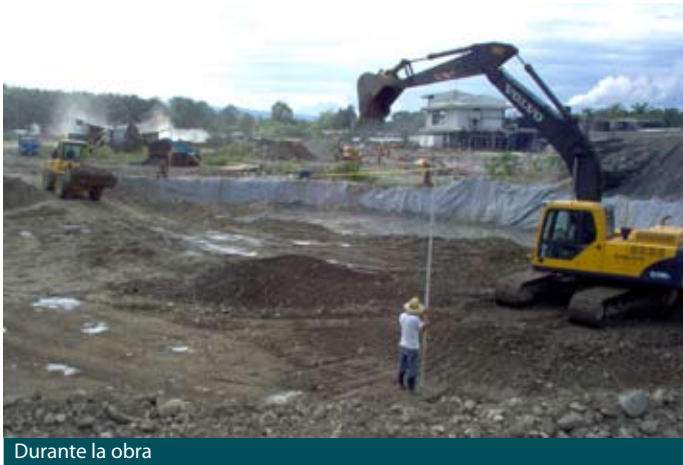
Durante la obra