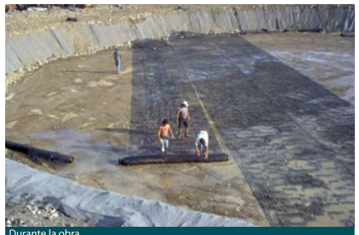
Durante la obra