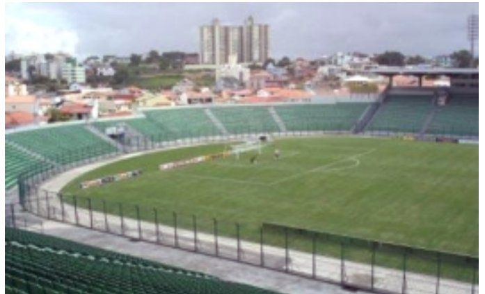
Después de la Construcción