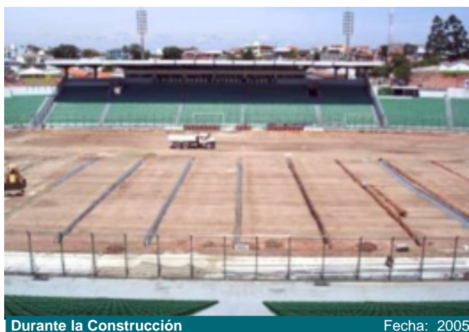
Durante la Construcción