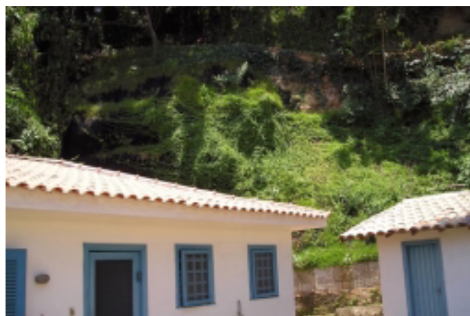
Depois da construção