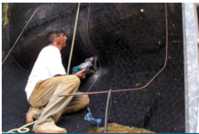
Durante a construção