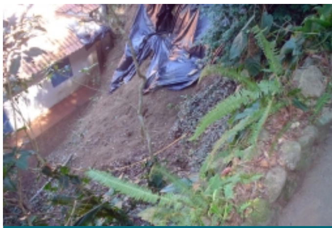
Antes da obra

Construção: 15/08/2005 Término: 30/08/2005