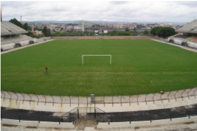
Después de la construcción